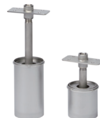
浮上油回収ノズル