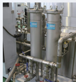
バッグ式フィルター (オプション)