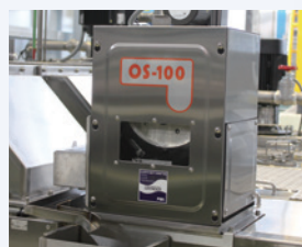
オイルスキマー (標準装備)