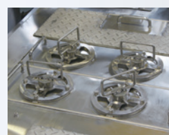
鉄磁濾BMT-900 (オプション)