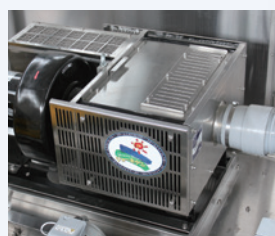
ジョーキゲン SC-400 (標準装備)